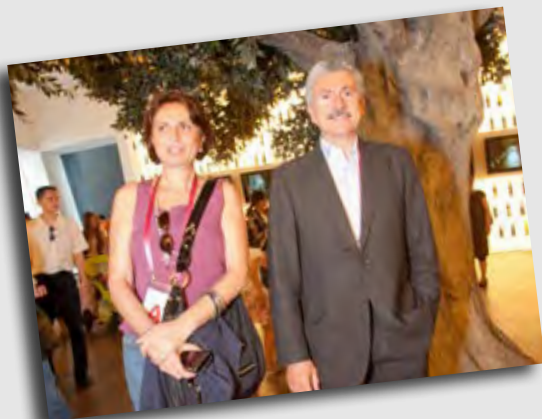
Massimo D'Alema, deputato, Presidente Fondazione Italiani Europei

A Shanghai stiamo dando un esempio della migliore Italia, creativa, lavoratrice e soprattutto onesta, sono molto soddisfatto di come stiamo comunicando il nostro Paese!