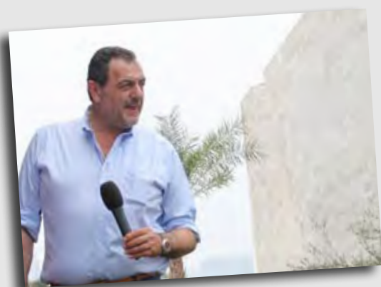
Gianfranco Vissani, Chef e conduttore televisivo

Il padiglione Italiano è uno dei più visitati, un orgoglio per noi italiani venire qui!