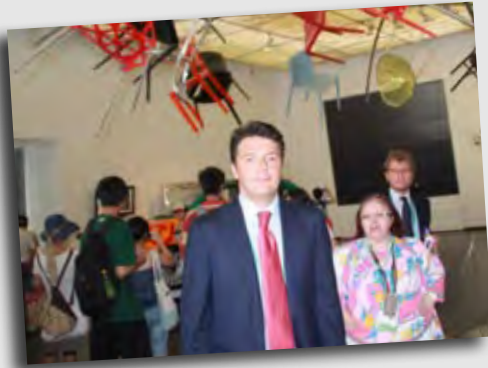
Matteo Renzi, Sindaco Firenze

Un padiglione che parla e racconta l'Italia migliore, quella di cui spesso ci dimentichiamo, da Fiorentino sono orgoglioso della riproduzione della cupola di Brunelleschi.