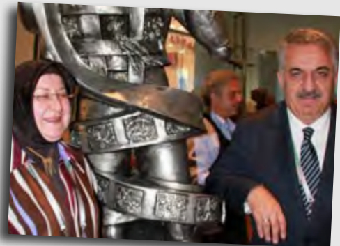
HAYATI YAZICI, Viceprimoministro turco

Un padiglione che parla e racconta l'Italia migliore, quella di cui spesso ci dimentichiamo, da Fiorentino sono orgoglioso della riproduzione della cupola di Brunelleschi.