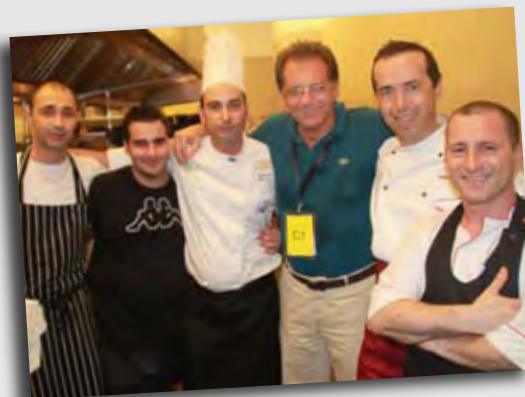
Alessandro Cecchi Paone, giornalista scientifico

A Shanghai stiamo dando un esempio della migliore Italia, creativa, lavoratrice e soprattutto onesta, sono molto soddisfatto di come stiamo comunicando il nostro Paese!