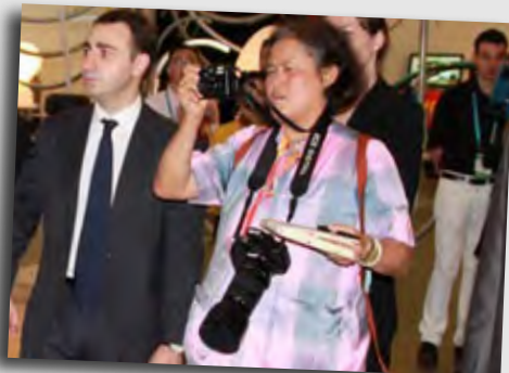
Maha Chakri Sirindhorn, Principessa della Thailandia

L'Italia mostra il meglio di sé nella più grande vetrina del mondo e sale sulla vetta più alta del futuro economico globale.