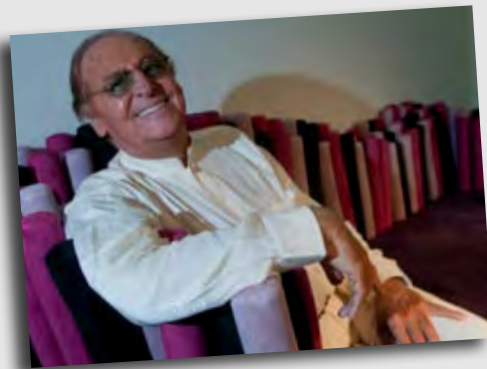
Renzo Arbore, showman

Secondo me è il più bel padiglione dell'Expo, un meraviglioso esempio di cosa l'Italia può dare al mondo.