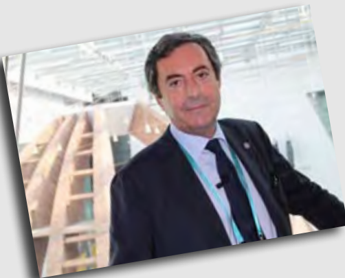
Attilio Romita, conduttore TG1

L'Italia mostra il meglio di sé nella più grande vetrina del mondo e sale sulla vetta più alta del futuro economico globale.