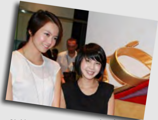
Gigi Leung, cantante e attrice da Hong Kong e Xu Ru Yun, cantante da Taiwan

Sicuramente uno dei padiglioni più sorprendenti, in cui le eccellenze Toscane sono protagoniste.