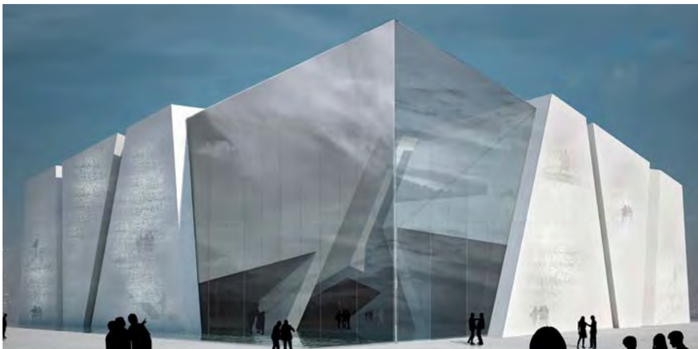
Una ricostruzione virtuale dell'ingresso del padiglione italiano, progettato dall'architetto Giampaolo Imbrighi e dai suoi Associati.

Rappresenterà il nostro modello di sviluppo, la nostra ricchezza e competenza sul tema del miglioramento della vita urbana